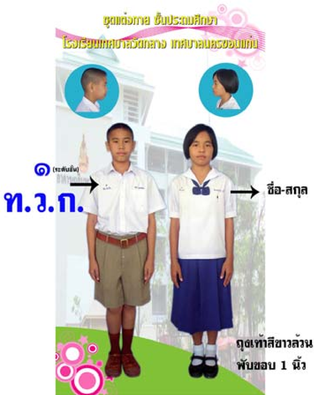
การแต่งกาย ชั้นประถมศึกษา ปีที่ ๔-๖