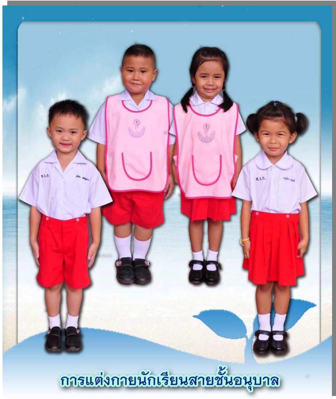
การแต่งกายนักเรียนสายชั้นอนุบาล