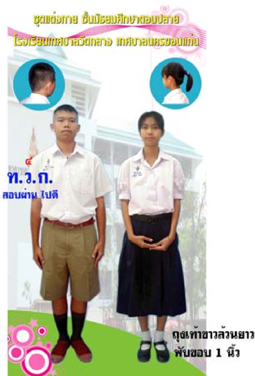
การแต่งกาย ชั้นมัธยมศึกษา ปีที่ ๔-๖