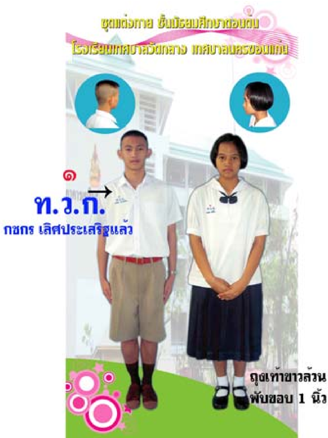
การแต่งกาย ชั้นมัธยมศึกษา ปีที่ ๑-๓