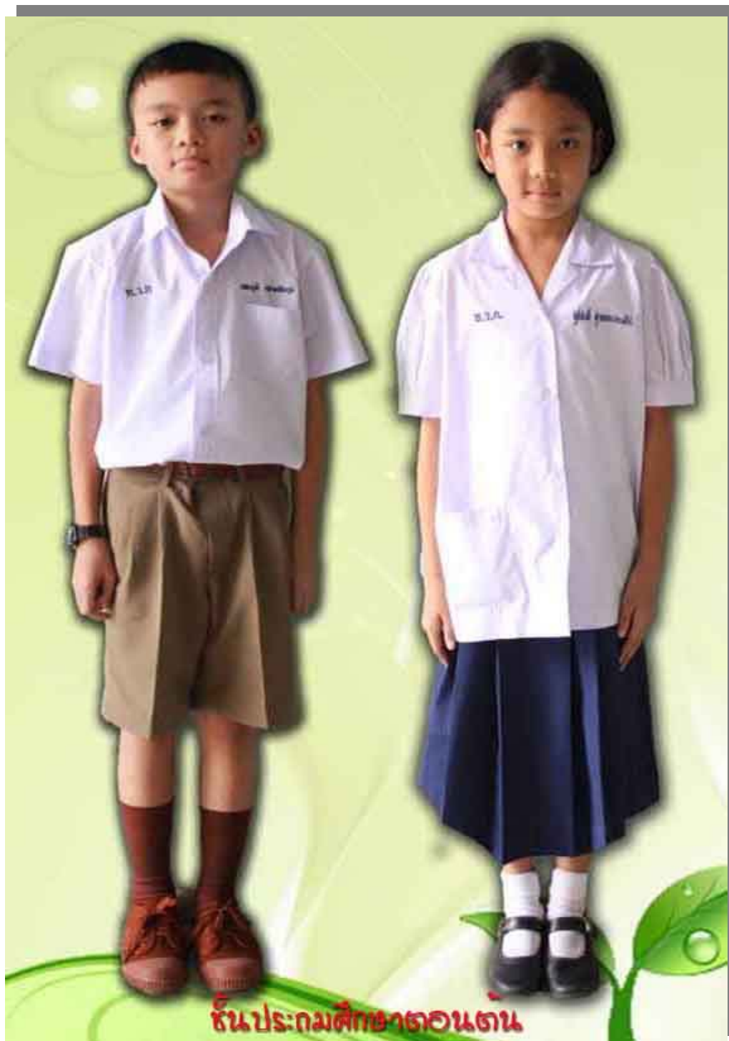
การแต่งกาย ชั้นประถมศึกษา ปีที่ ๑-๓