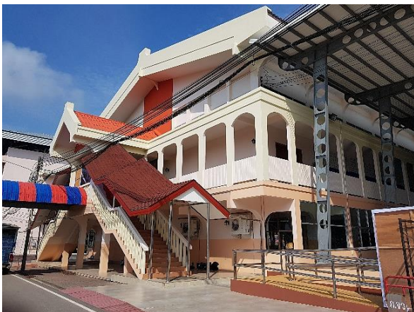
รูปสถานที่จัดการแข่งขัน

๓.๑ จัดการแข่งขัน ณ อาคารหอประชุมโรงเรียนวิทยาศาสตร์จุฬาภรณราชวิทยาลัย ตรัง เป็นห้องติด เครื่องปรับอากาศ