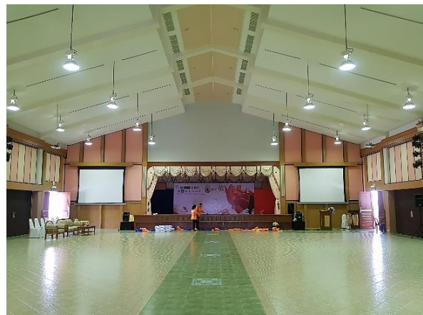
รูปภายในสถานที่จัดการแข่งขัน